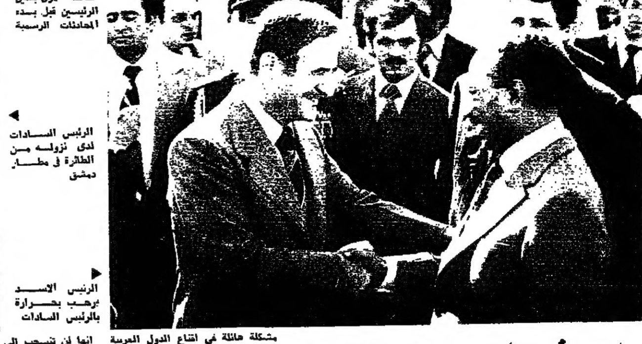
الرئيس السادات يرحب بصحابة الرئيسين السادات